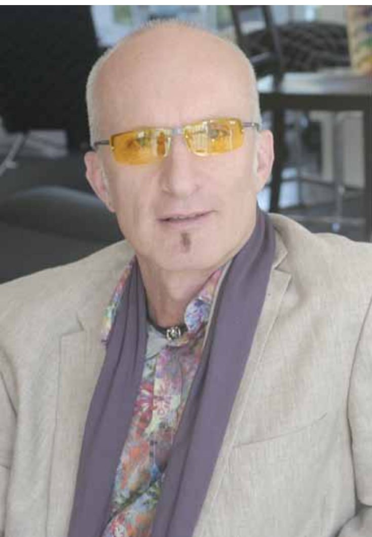
IMAGE: Ihre geschützte Marke PRiSMA® steht für Markenbrillen von höchster Qualität und dennoch erstaunlicher Preiswürdigkeit?

R.G.: Die Vitalbrillen® bzw. Farbbrillen zeichnen sich aus durch effektive Farbfilter mit konkurrenzlos hoch gesättigten und sehr klaren, reine Farben. Sie sind von hoher optischen Qualität und bruchfest, was Optikerqualität auszeichnet. Sie haben eine moderne, ansprechende Form. Es gibt eine sehr große Auswahl an Brillenmodellen, Varianten und Zubehör. Bluelightprotect Blaulichtschutz- und Computerbrillen filtern die kurzwelligen Anteile aus dem Quecksilber- und LED-Licht der Computer-Monitore und auch bei den meisten „modernen“ Beleuchtungsmitteln optimal heraus, eliminieren die Quecksilberlinie im blauen Bereich, kommen durch exakt definierte Farben mit sehr feinabgestimmter Filterwirkung mit sehr geringer Farbtiefe aus, sodass die ausreichende Farberkennung beim Arbeiten am PC oder auch beim Autofahren, sowie beim Fernsehen gewährleistet ist.